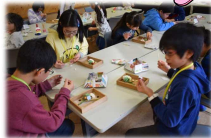
フラワーフレーム作り

冬休みの期間を利用し今年もジュニアボランティアスクールが2日間に渡り開催されました。物づくり（フラワーフレーム作り）、高齢者疑似体験、絵手紙作り、デイサービス利用者との交流など様々な体験をとおして、人との繋がりや相手の気持ちになることの大切さを学びました。