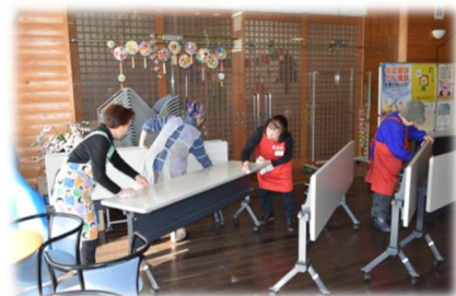
洗剤を使い、テーブルや椅子についた細かい汚れまできれいに拭き取りました。

ふれあいプラザ・サンピノで昨年12月22日（土）能代市ボランティア連絡協議会による毎年恒例の大掃除が行われ、個人・団体合わせて31名が参加されました。新年からも気持ち良く使用してもらいたいと普段中々手の届かない所まで丁寧に掃除が行われ掃除終了後は、能代市役所ねぎ課課長による講話と、能代市老人クラブ連合会の皆さんによる「ねぎ応援歌」を一緒に歌い交流を深めました。