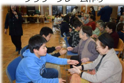
デイサービス利用者との交流