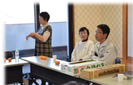
ねぎ課課長より、白神ねぎについて詳しいお話しをしていただきました。