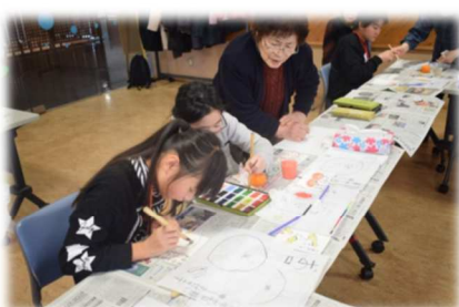
絵手紙（寒中見舞い）