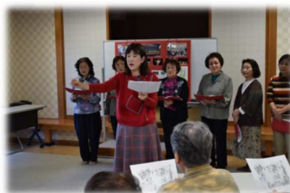
白神ねぎを盛り上げる応援歌と一緒に歌い踊りも披露していただきました。