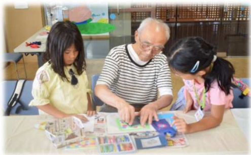
和みアート・高齢者交流