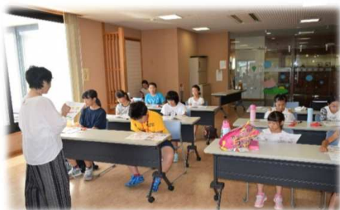
認知症キッズサポーター研修