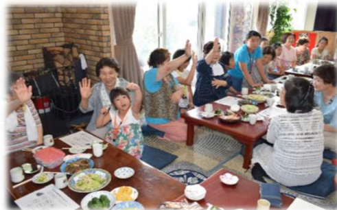
地域のサロン訪問